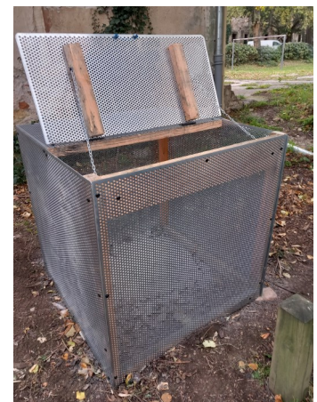
Exemple d'utilisation de la grille très solide (bac à cendres de 1000litres).